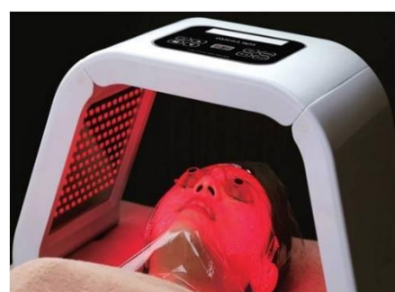
PDT FOTONOVÁ DYNAMICKÁ TERAPIE (SVĚTELNÝ TUNEL)