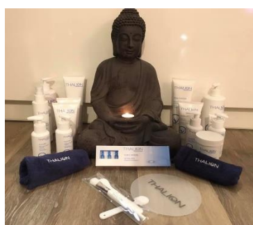
PROFESIONÁLNÍ MOŘSKÁ KOSMETIKA THALION