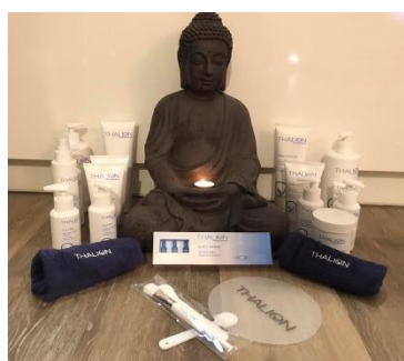
PROFESIONÁLNÍ MOŘSKÁ KOSMETIKA THALION