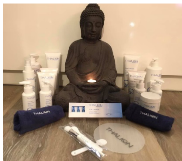
PROFESIONÁLNÍ MOŘSKÁ KOSMETIKA THALION

MOC RÁDA VÁM TAKÉ UDĚLÁM KVALITNÍ SYPANÝ ČAJ.